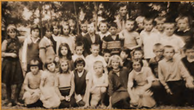
Učenici generacije 1954/1955.