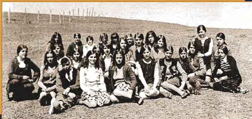
Prva generacija obrazovanja odraslih u Rajetiću, 1974. godina